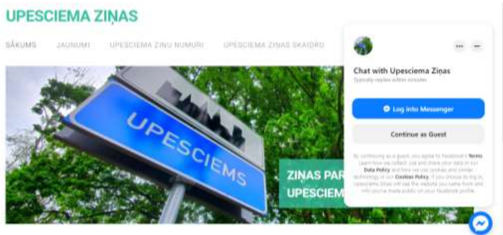
Attēls: “Ekrānuzņēmums no “Upesciema Ziņu” mājaslapas” ©Upesciema Ziņas

👉👉👉 visos gadījumos, lai uzsāktu saraksti, nepieciešams “sasveicināties” (nosūtīt, piem., “Sveiki”, “Labdien”, utt.) un pēc tam, kad pienāks atbilde, jānospiež uz pogas “sākt saraksti”.