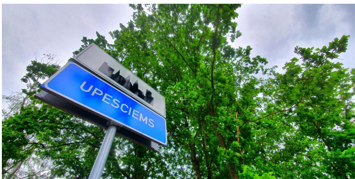
Attēls: "Upesciems"

Iespējams, šāda veida ziņu apkopojums ir pēdējais, jo no jaunā gada plānojam pārmaiņas! Par to, kādas, lasi šajā ziņu numurā.