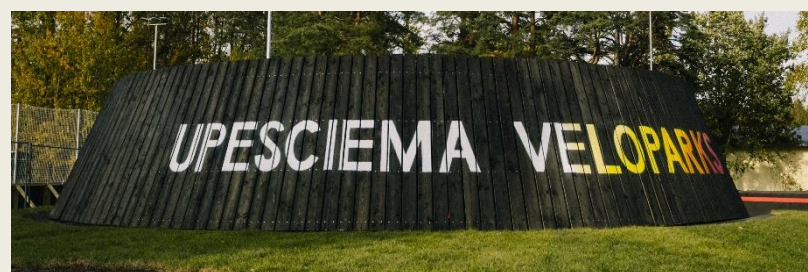
Attēli: "Upesciema Veloparks"