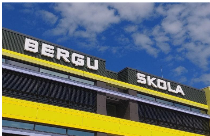
Attēls: "Berģu skola"