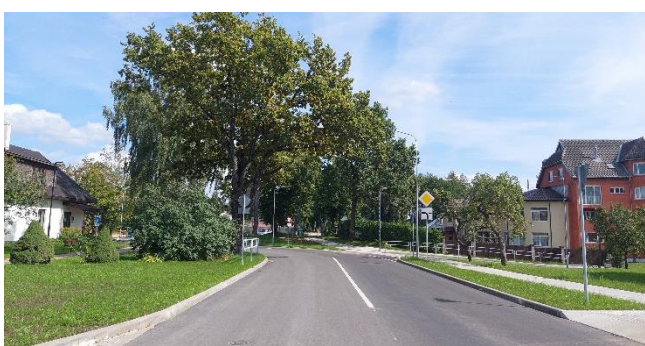
Attēls: "Jaunais Upesciema centrs"