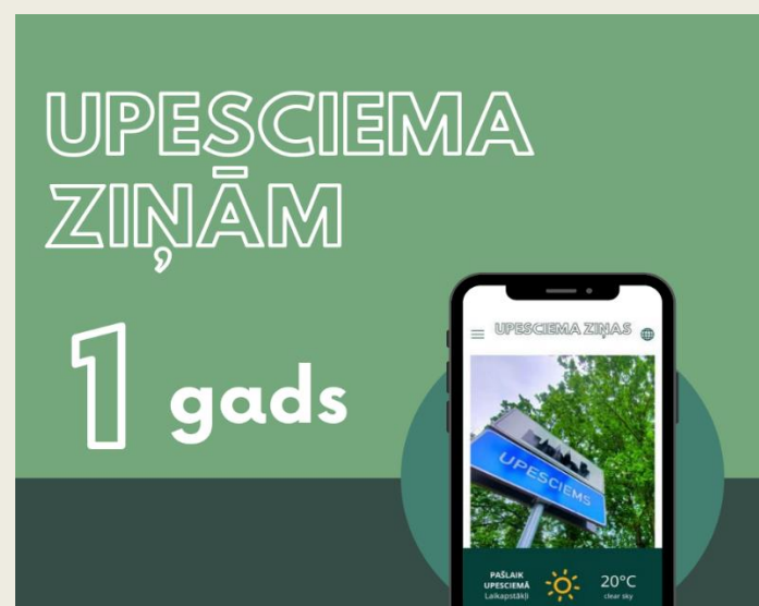
Attēls: "Upesciema Ziņām – 1 gads"

Paldies, ka esi kopā ar mums un lasi "Upesciema Ziņas"!