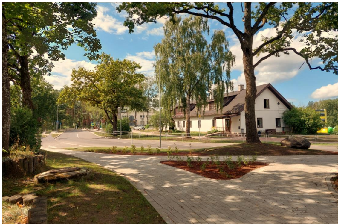
Attēls: "Jaunais Upesciema centrs"

Tika veikta lietus ūdens, ūdensapgādes kanalizācijas tīkla un elektroapgādes tīklu rekonstrukcija, kā arī tika izbūvēts stāvlaukums 41 automašīnai.