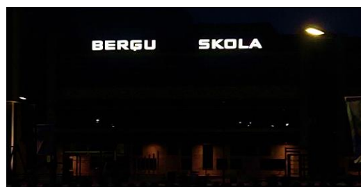
Attēls: "Berģu skola naktī" © Upesciema Ziņas

Naktī uzraksts tiek izgaismots, tāpēc Upesciema iedzīvotāji un ciemiņi jebkurā diennakts laikā var uzzināt, kas atrodas šajā ēkā!